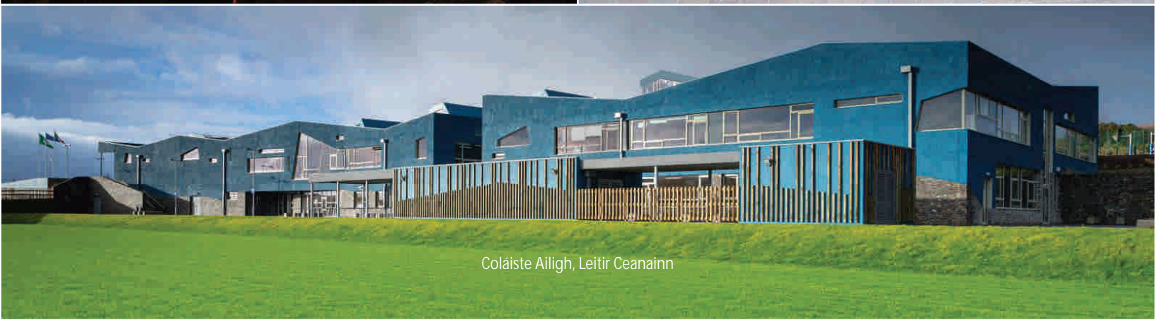
Coláiste Ailigh, Leitir Ceanainn