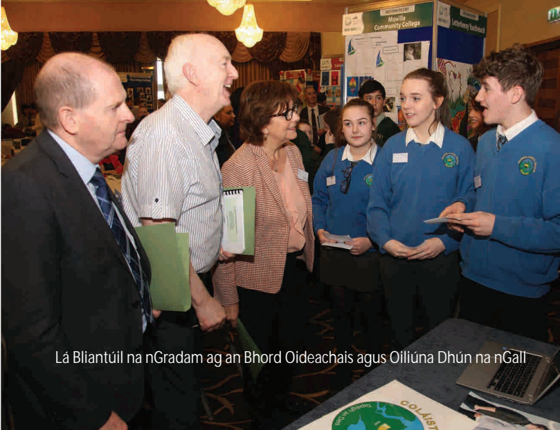
Lá Bliantúil na nGradam ag an Bhord Oideachais agus Oiliúna Dhún na nGall