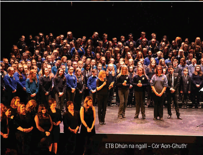
ETB Dhún na ngall – Cór 'Aon-Ghuth'