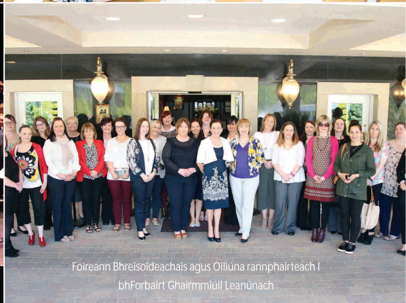
Foireann Bhreisoideachais agus Oiliúna rannphairteach i bhForbairt Ghairmmiúil Leanúnach